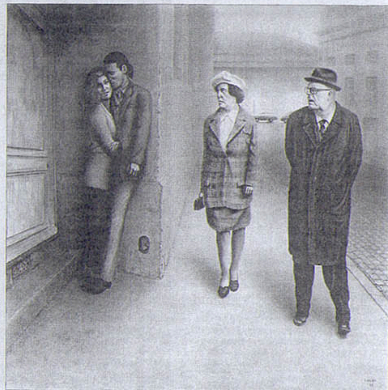
Een van de straatbeelden van Norbert Sauer.

Zo maakte hij het portret van 'Meneer de minister'. De arrogantie ten top, een karikatuur, maar dan wel geschilderd alsof het om een serieus portret gaat. En onder de titel 'Genadeloos Duits' rekt hij af met het prototype van zijn welvarende landgenoten. 'Ofwel veel fitness, weinig hersens in een platte kop en met een fout getinte zonnebril.' Sauer mag graag de draak steken met de gevestigde orde, zoveel is duidelijk. Een toppunt: het zotte portret van de god van de hedendaagse wetenschap, Albert Einstein. Minutieus precies geschilderd, in prachtig licht. Het portret zou zo in de bestuurskamer van een vooraanstaande universiteit kunnen hangen, ware het niet dat de schilder de geleerde een reusachtige, heel rode tong laat uitsteken naar de voorbijgangers. 'Waarom? Ach, zo maar een ideetje. Kunst hoeft toch niet altijd zo serieus te zijn? Ideeën heb ik meer